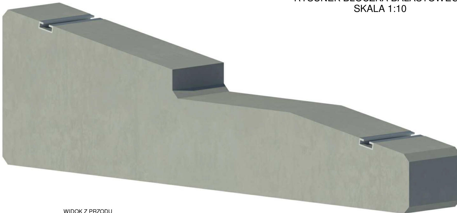
WIDOK Z PRZODU SKALA 1:10